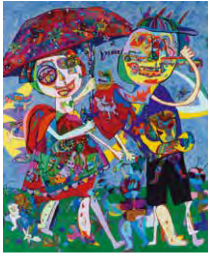
大賞 中村澄江 《愛しています》