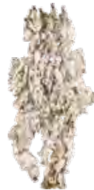
佳作 おおつきゆき 《私の名前は「軽居」命価です。》