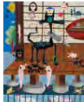
佳作 岡村邦彦 《母イノバスII(始まりはこれから)》