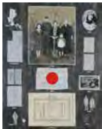
優秀賞 下平武敏 《昭和の記憶-Y家命のわかれ》