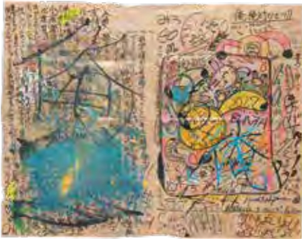
準大賞 中島隆誠 《I am home (super platform)》