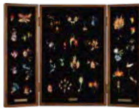
優秀賞 川越ゆりえ 《焰(2021)》