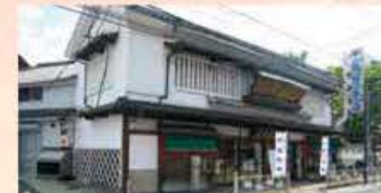
〈店舗改修前の千鳥屋本家 本店〉

白壁造りの美しい千鳥屋本家に生まれ変わり、リニューアルオープンした折には2階のミュージアムに楽しい品々を飾り、訪れる人々をお待ち致しております。