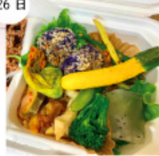
まんまるキッチン マクロビ弁当