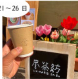
誉茶紡 日本茶ドリンク