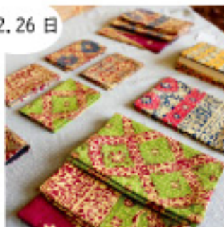
TORIKO インドネシア雑貨