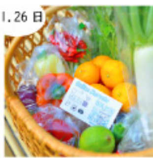
マレプル 新鮮野菜