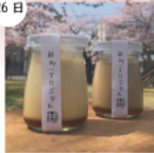
ことばや 新町一丁目ぷりん