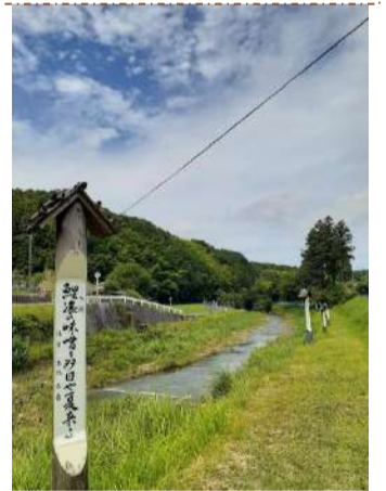
↑俳句の道【はいくのみち】 宮若全国俳句大会入選作を 顕彰する句碑が沿道に並び

※当日、受付でコースマップをお渡しします。 ※おもてなしブースではトイレ休憩ができるほか、地元で採れた旬の味覚サービスや数量限定販売も。何があるかは当日のお楽しみ♪ ◇スタート・ゴールの西鞍の丘総合運動公園内はペット禁止です。 ◇農道や川沿いも歩きます。歩きやすい服装でお越しください。 ◇歩道のない道や民家のそばも通ります。ルールやマナーを守って楽しいウォーキングイベントにしましょう。