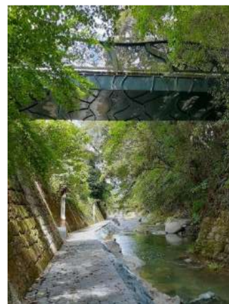
←楽水之径【らくすいのみち】 脇田温泉街を流れる 犬鳴川沿いの遊歩道