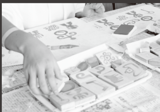
装飾文様トートバッグ作り

装飾古墳に描かれて いる、色々な文様を 使って、自分だけの トートバッグを 作ろう！