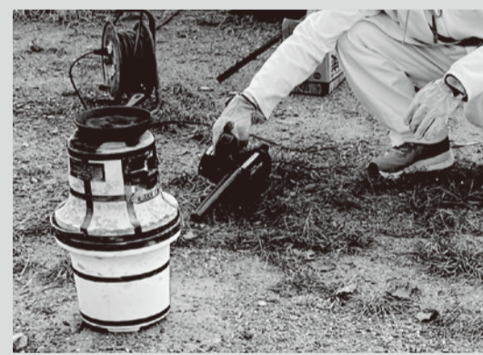
古代絵具クレヨン作り

竹原古墳には赤と 黒の絵具が使われ ているよ。絵具の材 料を使って、クレヨ ンを作ってみよう！