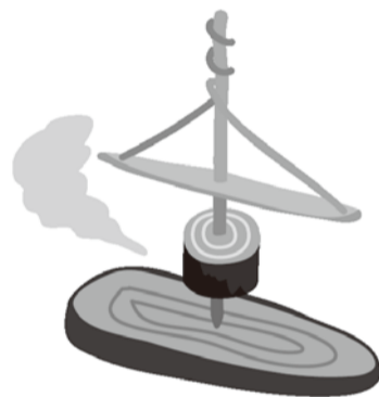
火起こしチャレンジ ※雨天中止

装飾古墳に描かれて いる、色々な文様を 使って、自分だけの トートバッグを 作ろう！