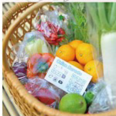
マレブル 新鮮野菜