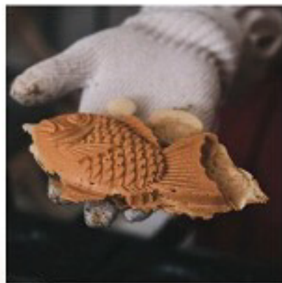
あまねや たいやき販売