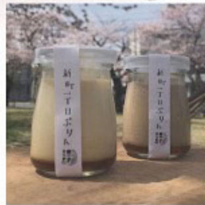
ことばや 新町一丁目ぷりん