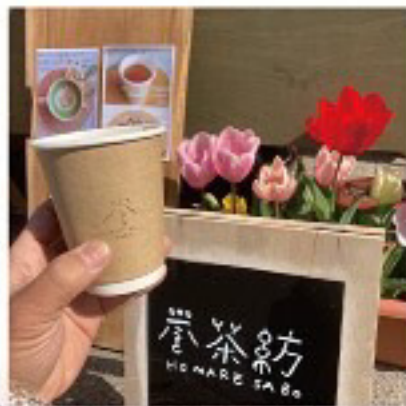
誉茶紡 日本茶ドリンク