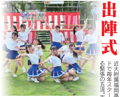
近大附属福岡高校バトンの3年生はこの演技後に引退します。最後の演技となるバトンの姿に感動します

約三千人の昇き手を奮い立たせる檄文を披露。男衆に気合を入れる様は名場面です。檄文者に選ばれたことはとても名誉なこと、勢いのある者が努めます。