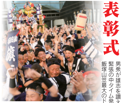
五流それぞれの感情が交差する表彰式は15日間の最後を飾る興奮絶頂の最終幕です