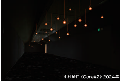
中村禎仁 (Core#2) 2024年

かつて炭坑産業で栄えた田川市には、「やみ」が支配する坑道という地下と、「ひかり」に満ちた地上という対照的な2つの世界が存在していました。本展は、こうした筑豊・田川の地域性を美術館の展示室に再現しようとするものです。「やみ」と「ひかり」をそれぞれの視点でとらえる4名の現代作家の作品が展示室いっぱいに広がります。体感型のインスタレーションや体験型のメディアアートをとおして、からだ全体でアートを楽しめる機会となります。見て、触って、聴いて...様々な感覚を刺激するアートをお楽しみください。