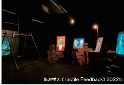
塩澄祥大 (Tactile Feedback) 2022年