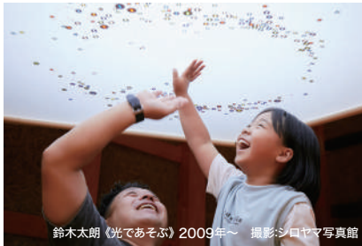
鈴木太郎 (光であそぶ) 2009年〜