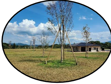
Play area プレイエリア