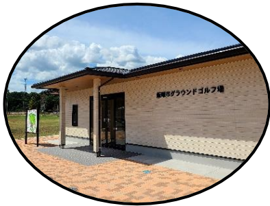
Club house クラブハウス