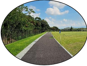
Walking course ウォーキングコース