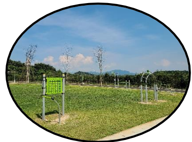
Exercise space 運動スペース