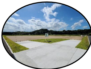
Multipurpose plaza 多目的広場