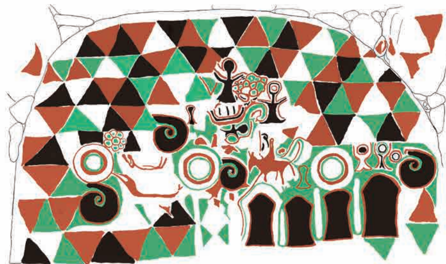
田代太田古墳(佐賀県鳥栖市)