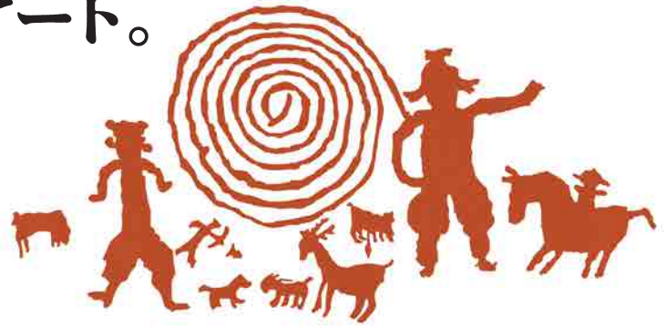
清戸迫76号横穴墓(福島県双葉町)

装飾古墳の「壁画」は様々な文様が描かれていて、文字資料がとて少ない古墳時代の生活や文化を今に伝えています。 装飾古墳として唯一、特別史跡に指定されている王塚古墳は2024年に石室発見90周年を迎えました。 さらに王塚装飾古墳館も開館30周年を迎えたことを記念し、今回の企画展は装飾古墳の壁画をトレース、ほぼ実物サイズで紹介していきます。 ミステリアスな古墳時代のアートをご体験ください。