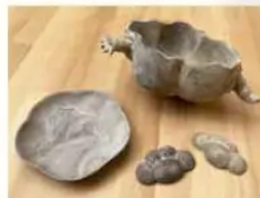
「オープン粘土で陶芸体験」参考作品