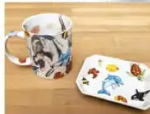
「転写紙で絵付け体験」参考作品

ワークショップ予約・お問い合わせ ▶ 0949-22-0038 (直方谷尾美術館)