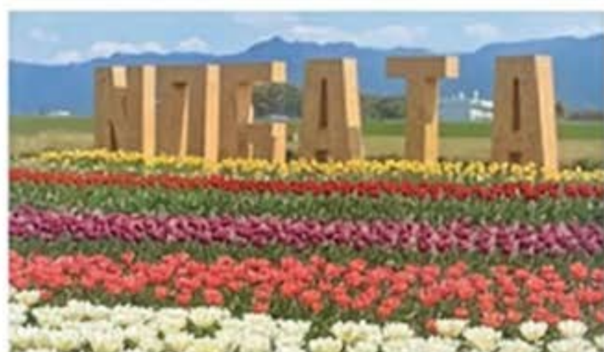
のおがたチューリップフェア

直方市の春を彩る「チューリップ」が主役のデザインです。手掛けたのは、市の初代ふるさと応援大使を務め、「ねこ」をモチーフとする作品で人気の切り絵クリエイターKENさん。毎年春に遠賀川河川敷で開催される「のおがたチューリップフェア」は、市が推進する「花のまちづくり」を象徴する光景として広く親しまれています。デザインには、満開の花々に囲まれて市の銘菓「成金饅頭」を美味しそうにほおぼる愛らしいねこの姿が描かれ、その頭にとまったテントウムシが、うららかな春の訪れを告げています。このマンホール蓋を通じて、下水道の大切さと共に直方市の魅力をお楽しみください。